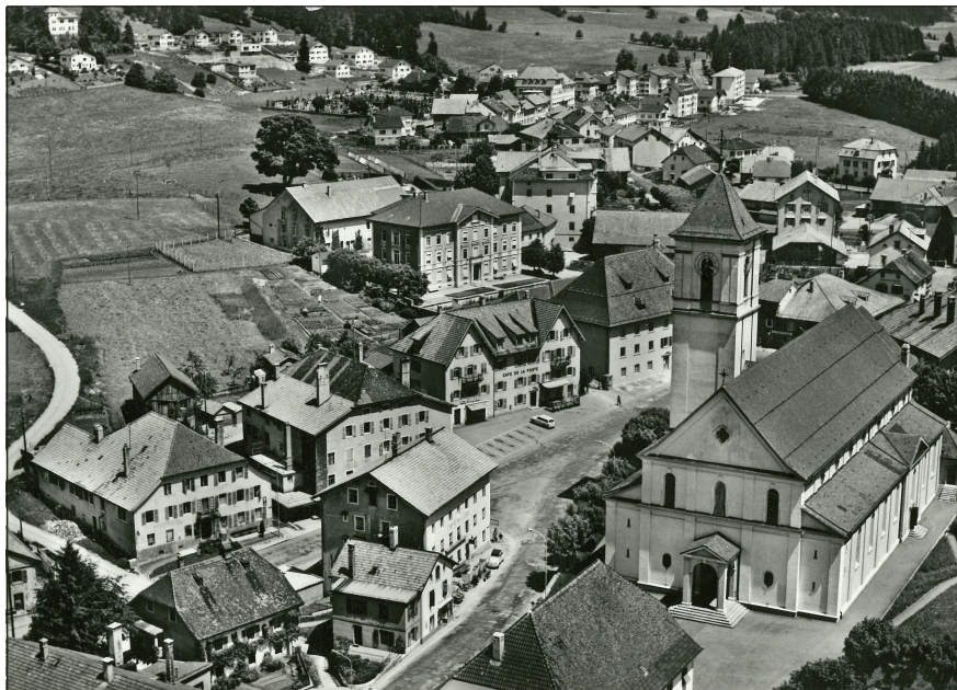
Carte postale de Saignelégier

Jura-24, c'est trois mois d'expositions et d'événements aux quatre coins du canton pour fêter le plébiscite du 23 juin 1974. Le jubilé commence le 23 juin et dure jusqu'à fin septembre.