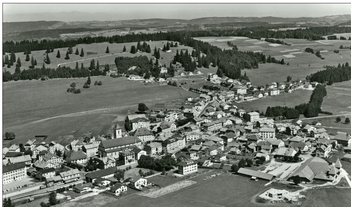
Carte postale de Saignelégier