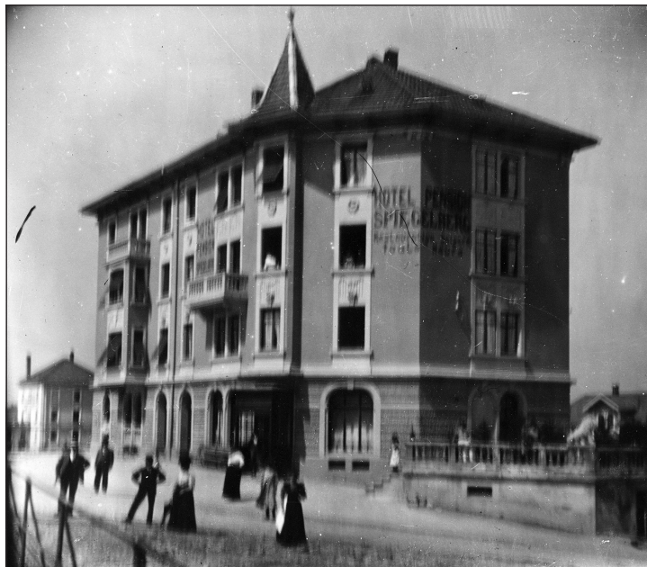
Photo d'Eugène Cattin, Saignelégier, Hôtel Spiegelberg, ArCJ, 137 J 290 b