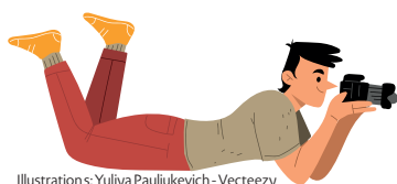
Illustration: Yuliya Pauliukovich - Vecteezy

Écrivez à camille.rerat@saignelegier.ch !