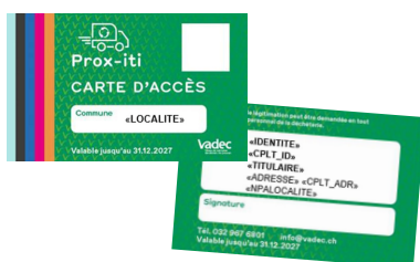
Image indicative de la carte d'accès

D'ici la fin de l'année, chaque ménage et entreprise de Saignelégier recevra sa carte d'accès Prox-iti, indispensable pour accéder aux encombrants dans les communes Franc-Montagnardes participantes.